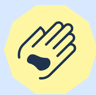
Infecciones por hongos